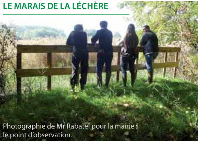
le point d'observation.

Les travaux sur le marais de la Léchère ont été réceptionnés avec l'entreprise Jordan et l'association Avenir par la municipalité le mardi 4 octobre 2011. La première phase a été constatée sans réserve. Il s'agit des travaux hydrauliques, à savoir :