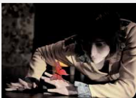
«Le monde de Babelou», spectacle chorégraphique, onirique et poétique qui rend hommage à la nature, par la compagnie «Les ailes de Babelou». Durée : trente minutes.

le jeudi 17 novembre à 10h30 puis à 14h30 à l'école Dufy, au Village et le vendredi 18 novembre, à 10h30 au préau Laurencin, à la Plaine. Ces séances seront offertes par la commune à toutes les maternelles de Tignieu-Jameyzieu, soit 289 petits spectateurs prévus, qui viendront sur le temps scolaire, accompagnés de leurs professeurs des écoles.