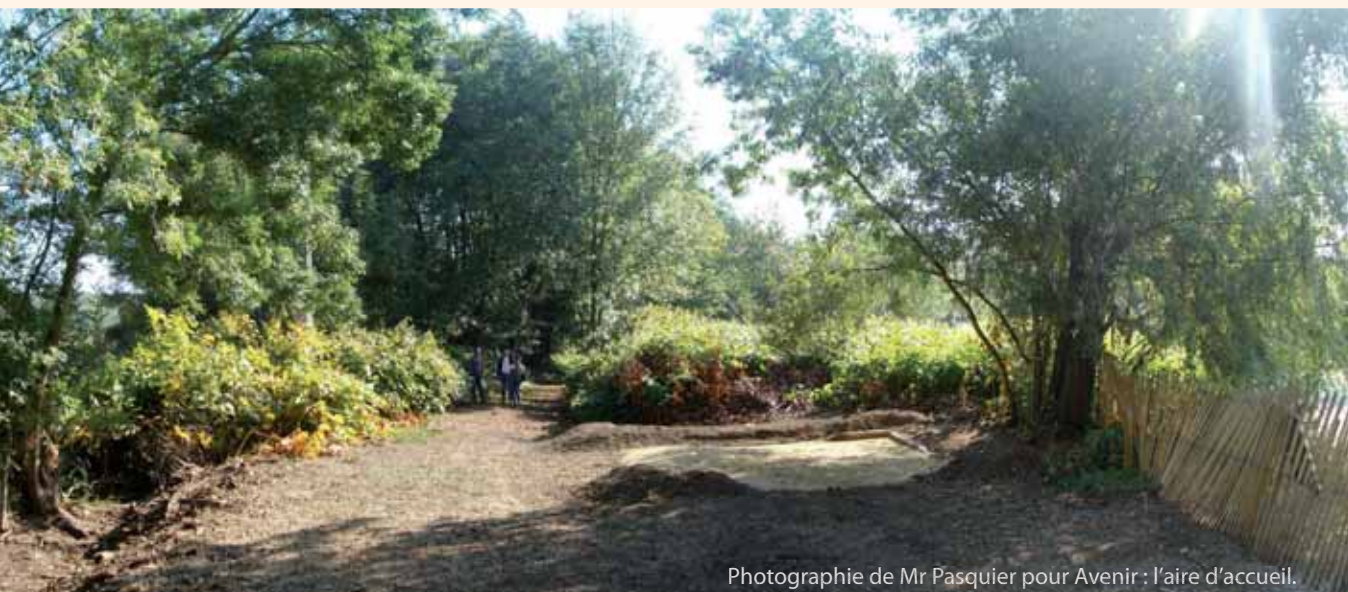
l'aire d'accueil.