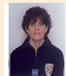
Nouveau policier municipal après le départ en retraite d'un policier

Si vous êtes intéressés et que vous êtes chauffés à l'électricité, n'hésitez pas à nous contacter par téléphone au 04 89 12 08 43 ou par mail : isere@voltalis.com